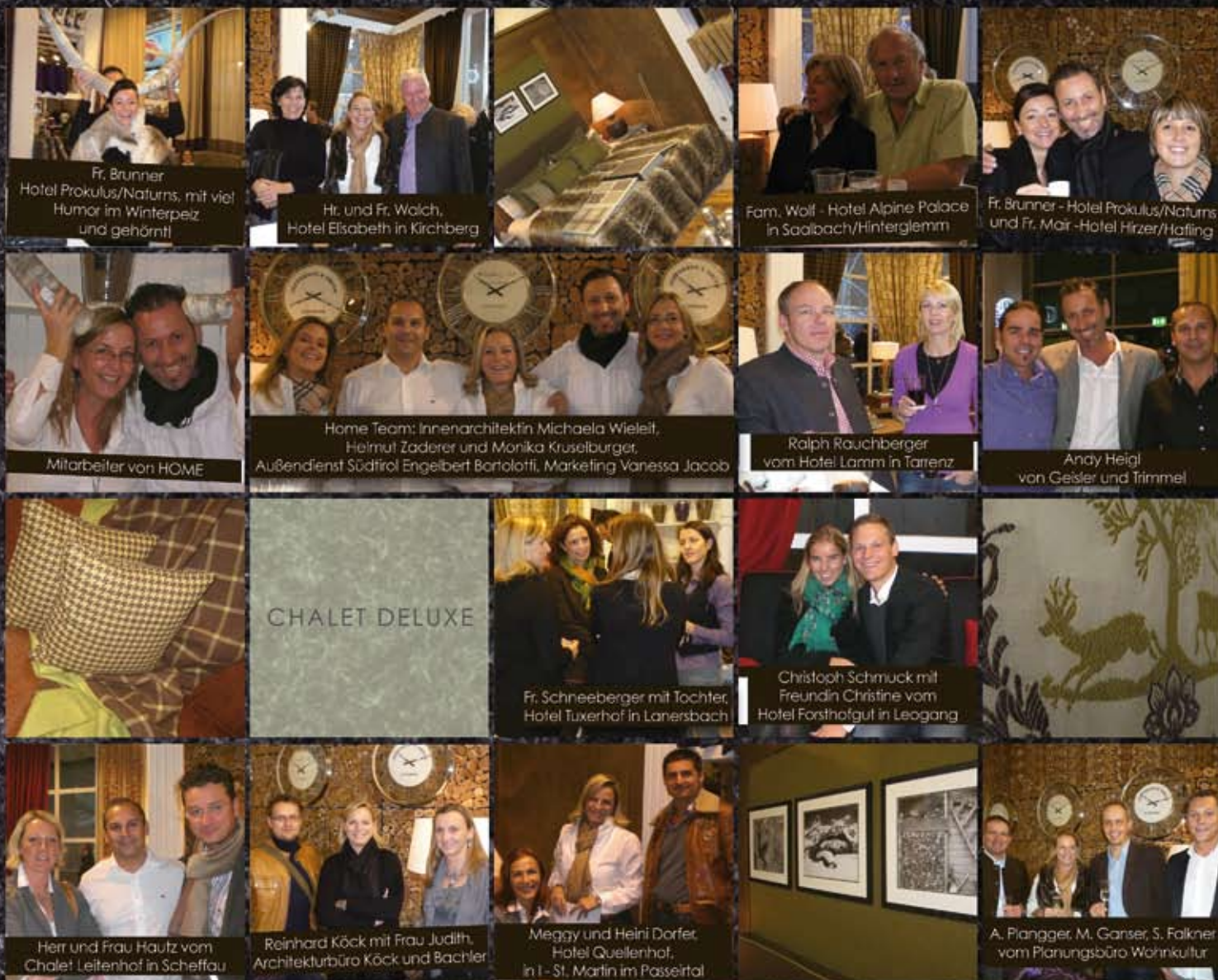
Fr. Brunner Hotel Prokulus/Naturns, mit viel Humor im Winterpeiz und gehört!